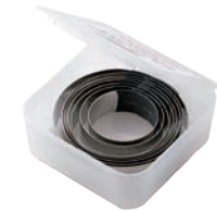
キャリパーピストン インストーラーセット (KPR-8S)